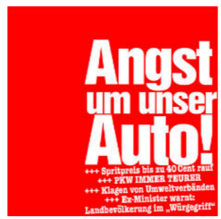
Anke Stiller, MOVING WORDS - HEADLINES (Detail), Wandinstallation, Druck auf Alufolienpapier, 2025.

The rapid and uncontrolled spread of information via social networks in conjunction with the image, video and text generation of artificial intelligence and the use of complex algorithms makes the distribution of deliberate half-truths, disinformation campaigns, conspiracy theories or politically motivated propaganda simple and effective. The spread of fake news can have serious consequences, including distorting public opinion, spreading mistrust of established media and institutions, and in some cases even fuelling violence or social unrest. Yet we seem to be aware of these influences! We hear about manipulative election interference, hybrid warfare, deep fakes and cybercrime. Even if we are aware of the importance of extended media literacy and the ability to critically analyse information and use trustworthy sources, we find it difficult to question and re-sort the truth parameters we are familiar with, as we are evolutionarily dependent on visual and auditory