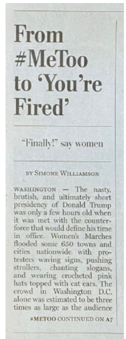
The Yes Men, Detail aus Trump is over - if you want it First fake release (BREAKING), The Washington Post, 1st of May 2019.